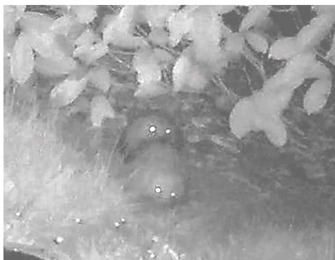
Photos prises de nuit