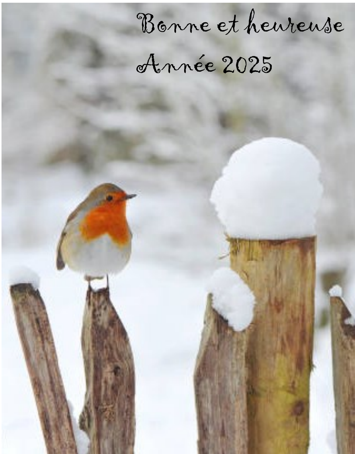
Oiseau de l'année 2025 : Rouge-gorge familier