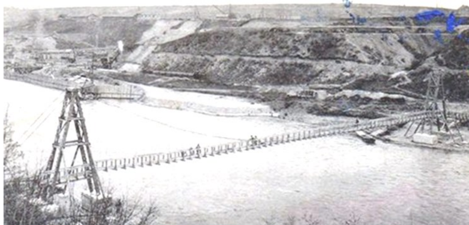
2. POUIGNY-CHANCY — Construction du barrage sur le Rhône - La Passerelle suspendue (Travaux de la Société Générale d'Entreprises - E. LOCHER et Cie)